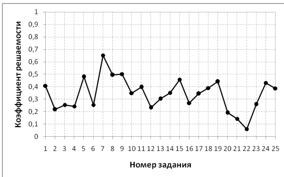
Рис. 3. График коэффициентов решаемости заданий по результатам тестирования

График коэффициентов решаемости заданий (рис. 3) позволяет сделать анализ качества подготовки обучающихся по контролируемым темам дисциплины. Значения коэффициентов решаемости для заданий рассчитывались как отношение числа студентов, решивших задание по данной теме, к общему числу участников тестирования. По вертикальной оси отложены значения коэффициентов решаемости заданий, по горизонтальной оси указаны номера тем.