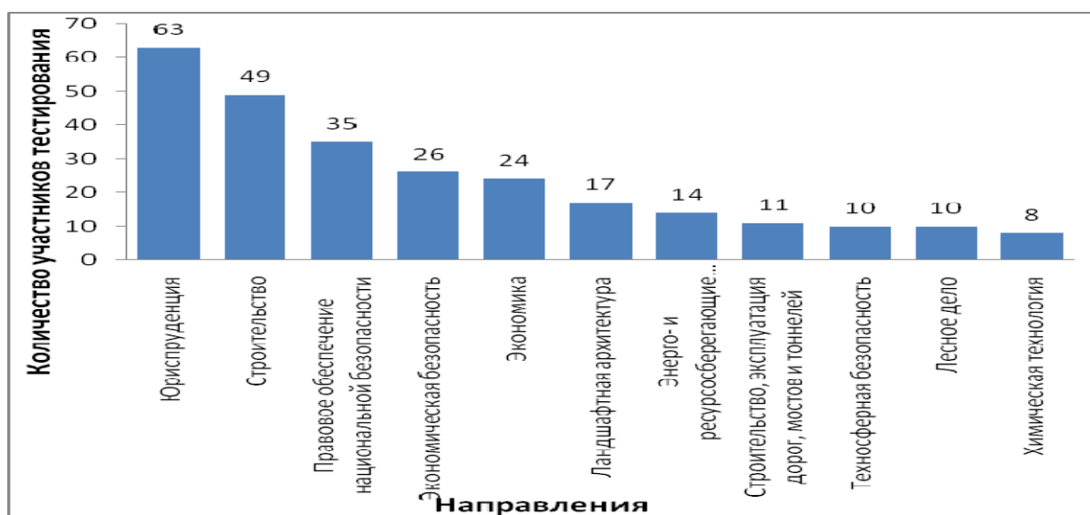
Рис. 1. Участие в тестировании студентов по направлениям

Анализируя содержимое университетских программ дисциплины «Информатика» направлений бакалавриата и специалитета, можно сделать вывод, что школьный и вузовский курсы информатики достаточно близки по содержанию. Отсюда следует, что основная задача университетского курса информатики – углубить и расширить знания, полученные в школе. Знания основ дисциплины, получаемые обучающимися в школе, являются обязательным условием дальнейшего успешного освоения информатики в высшем учебном заведении. Всего по кафедре информатики участвовало в тестировании 267 студентов 11 направлений (рис. 1).